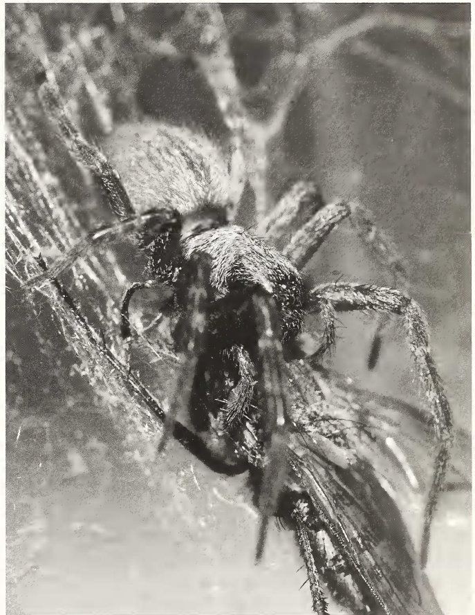
Abb. 1: Badumna longinqua beim Verzehr einer Fliege.

Die Herkunft der Spinne konnte nicht geklärt werden. Die Pflanzen in der Gartenabteilung des Baumarktes stammen von Großhändlern aus den Niederlanden und Deutschland. Möglicherweise handelt es sich nicht um eine direkte Einschleppung aus den ursprünglichen Herkunftsländern